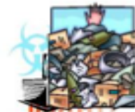
Residuos De Manejo Esp