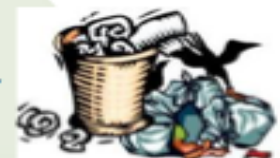
Residuos Sólidos Urbanos